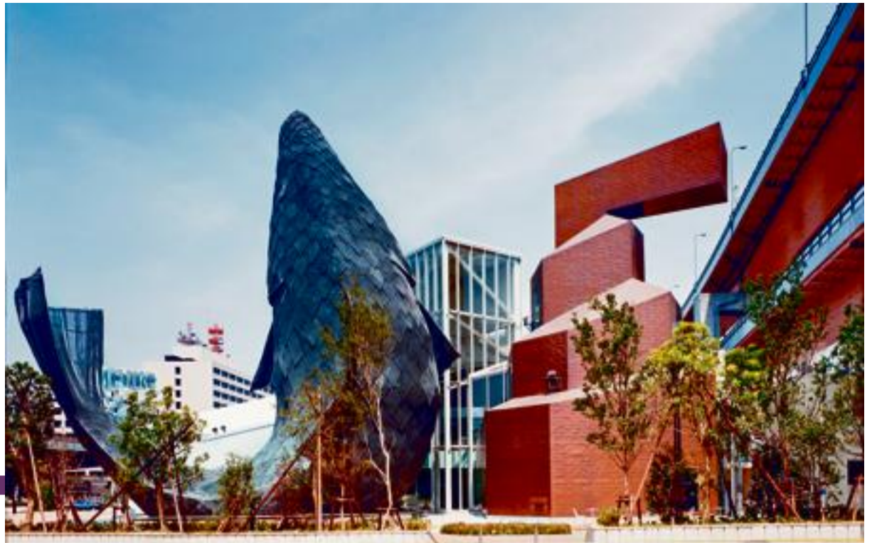
« Cafe Fish ! », de Frank Gehry, à Kobe, au Japon : un ensemble de deux bâtiments et d'une sculpture (1986-1987).